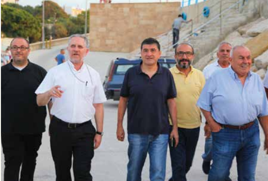
معاينة الموقع قبل حفل التكريس

بدورها، أصدرت وزارة الأشغال التي تعمل على إعادة تأهيل الميناء قراراً وافقت بموجبه على وضع تمثال سيّدة البحار على الواجهة البحرية لميناء عمشيت. وللغاية استحدثت المؤسسة فريقاً مؤلفاً من